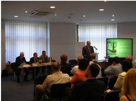
High-level training, 10 iunie 2010, București