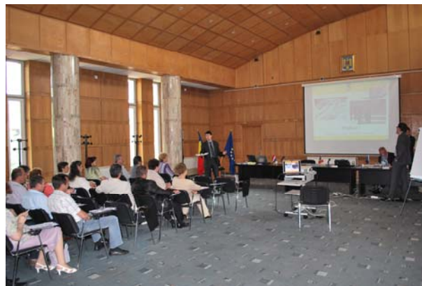
Curs « Controlul intern » – nivel avansat, 31 mai – 1 iunie 2010, Râmnicu-Valcea

• Cursul “Control intern” – nivel avansat/ activitatea 5.2.4., la Râmnicu – Vâlcea, între 31 mai și 1 iunie 2010. La acest curs au participat 33 de persoane, din structurile administrației publice locale.