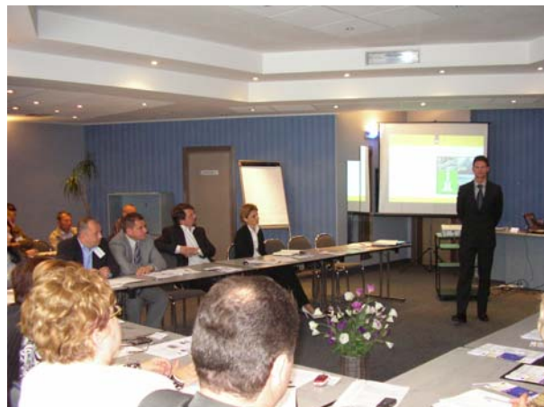
Curs « Controlul intern » – nivel avansat, 3 iunie – 4 iunie 2010, Oradea...

• Cursul “Control intern” – nivel avansat/ activitatea 5.2.4., la Oradea , între 3 iunie și 4 iunie 2010. La acest curs au participat 35 de persoane, din structurile administrației publice locale.